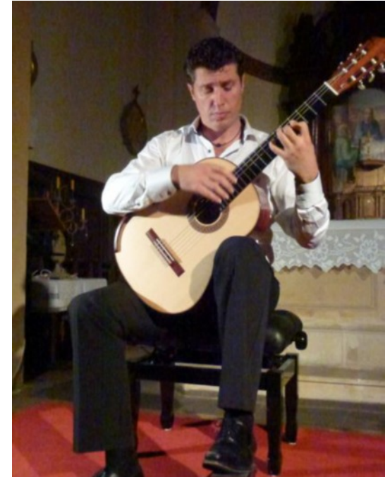
Souvenir de 2012, 10 ans déjà

Association « Courants d'Arts » Domaine des lions 03130 LUNEAU